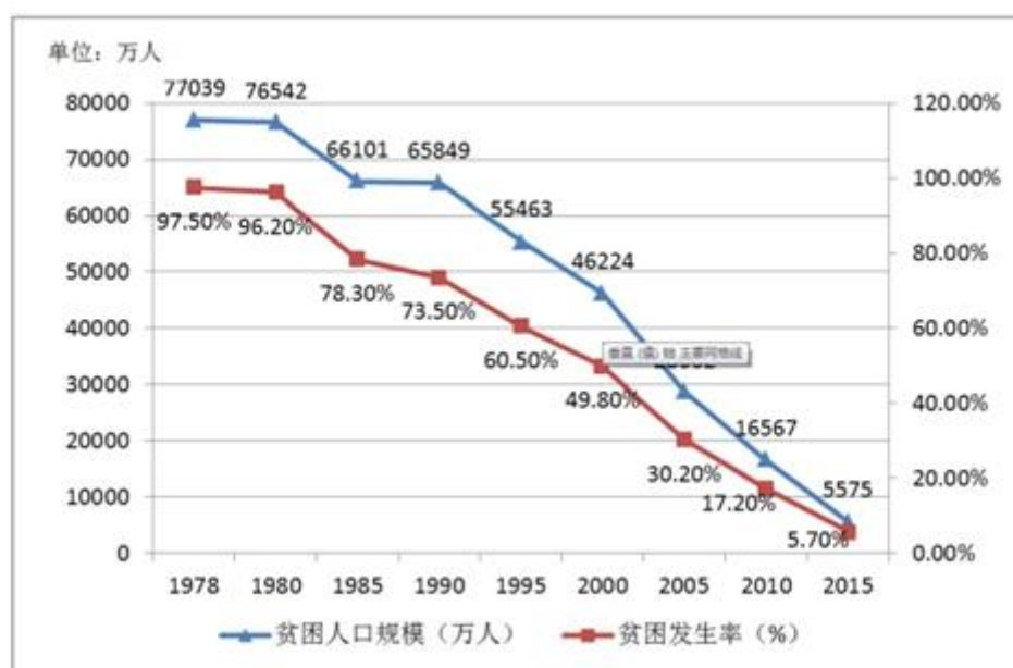
按现行农村贫困标准衡量的农村贫困状况

党，把科学真理同中国实际相结合，开启了中国历史上最为深刻的伟大革命，从“走俄国人的路”到“走自己的路”，开辟出一条中国革命、建设、改革的成功道路，用伟大创造点亮伟大梦想的明灯。这是人民追求美好生活的逻辑，“民亦劳止，汔可小康”，“人民，只有人民才是历史的创造者”，摆脱贫困、解决温饱、实现小康、迈向现代化，人民群众过上好日子的历史要求和无穷力量，推动着一次又一次的社会变革，也形塑着当代中国的崭新模样。